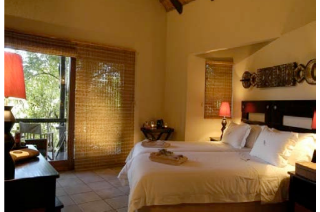
Chalet der Kuname River Lodge