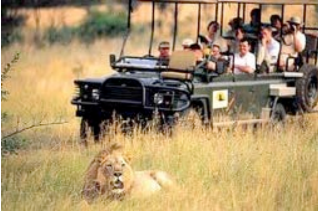
Geführte Pirschfahrt im offenen Geländewagen

Im privaten Karongwe Wildreservat liegt die luxuriöse Kuname River Lodge. Das Reservat beheimatet neben vielen weiteren afrikanischen Wildtieren auch die Big Five. Die Lodge gehört zu den besten Safari-Unterkünften des Landes. Die privaten Chalets haben Bad/WC, Klimaanlage, Tee/Kaffeezubereiter, Veranda mit Außendusche. Die Lodge bietet einen Pool, einen Boma = traditioneller Essensplatz, eine Bar und Restaurant.