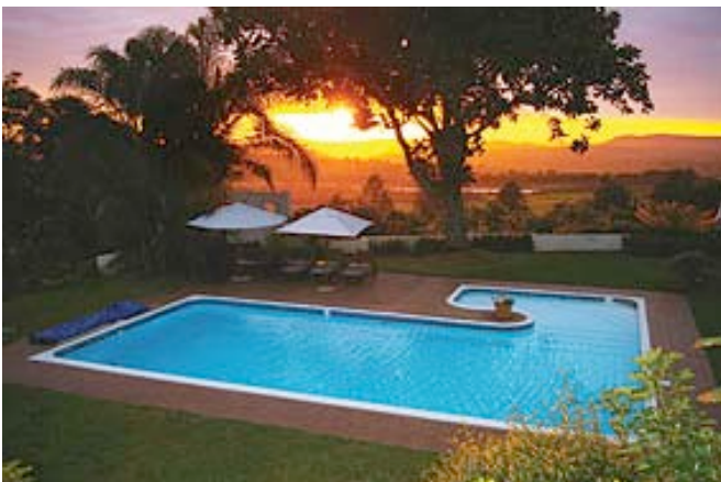
Pool des Plumbago Gästehauses

Sie übernachten in einem luxuriösen Landgästehaus etwas außerhalb von Hazyview mit wunderschönem Blick auf das Lowveld. Alle Zimmer haben: Bad/WC, Klimaanlage, Tee/Kaffeezubereiter, Minibar und Veranda. Die Unterkunft verfügt über einen Pool, ein Restaurant, eine Bar und einen schönen Garten.