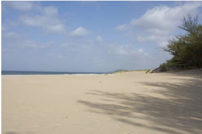
Am Strand von St. Lucia