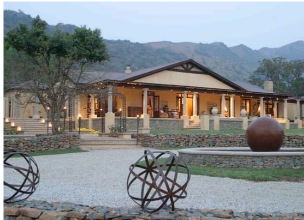
Dawsons Game & Trout Lodge