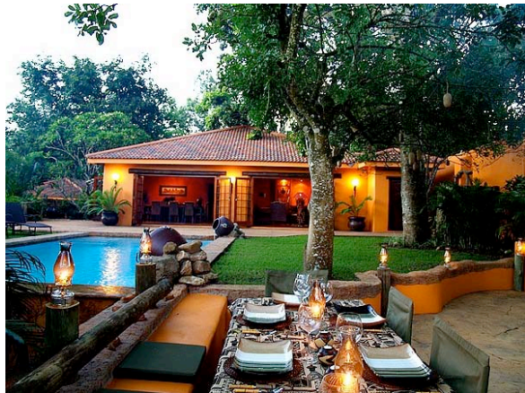
Garten und Pool