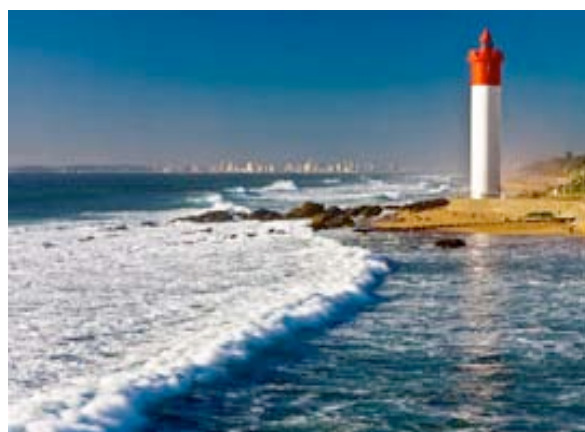
Leuchtturm von Umhlanga