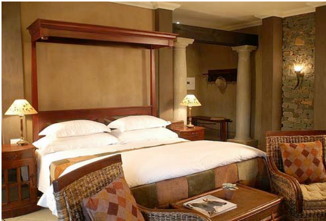
Zimmer der Dawons Lodge

Am Komati River zwischen Barberton und Badplaas liegt in einem privaten Naturschutzgebiet in wunderschöner Umgebung die luxuriöse Dawsons Game & Trout Lodge. Das Gebiet bietet Entspannung und Erholung pur. Sie können im Fluss Forellen angeln oder zu Fuß die Tiere des Reservats (Giraffen, Zebras, Antilopen und mehr) entdecken. Alle Zimmer haben Bad/WC, Kamin, Minibar, Tee/Kaffeezubereiter, Veranda. Die Unterkunft bietet einen Pool, ein Restaurant, eine Bar, ein TV-Lounge sowie ein großes Außengelände.