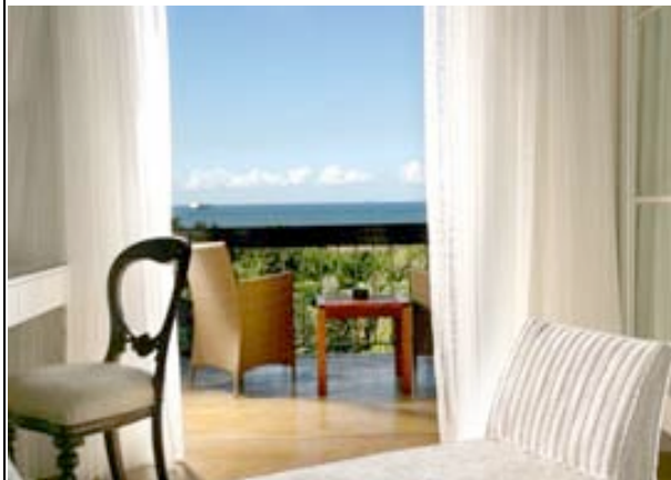
Suite der Teremok Lodge

Im ruhigen Ferienörtchen Umhlanga, nur wenige Meter vom Meer entfernt mit einem tollen Ausblick, liegt die luxuriöse Teremok Lodge. Viele Shops, Restaurants und Cafes erreichen Sie in wenigen Autominuten. Die 8 Suiten verfügen über Bad/WC, Klimaanlage, Kaffee/Teezubereiter, TV, Minibar, Safe, Balkon oder Veranda. Die Lodge bietet einen Pool, Garten, Lounge, Bar, Spabereich (geg. Gebühr).